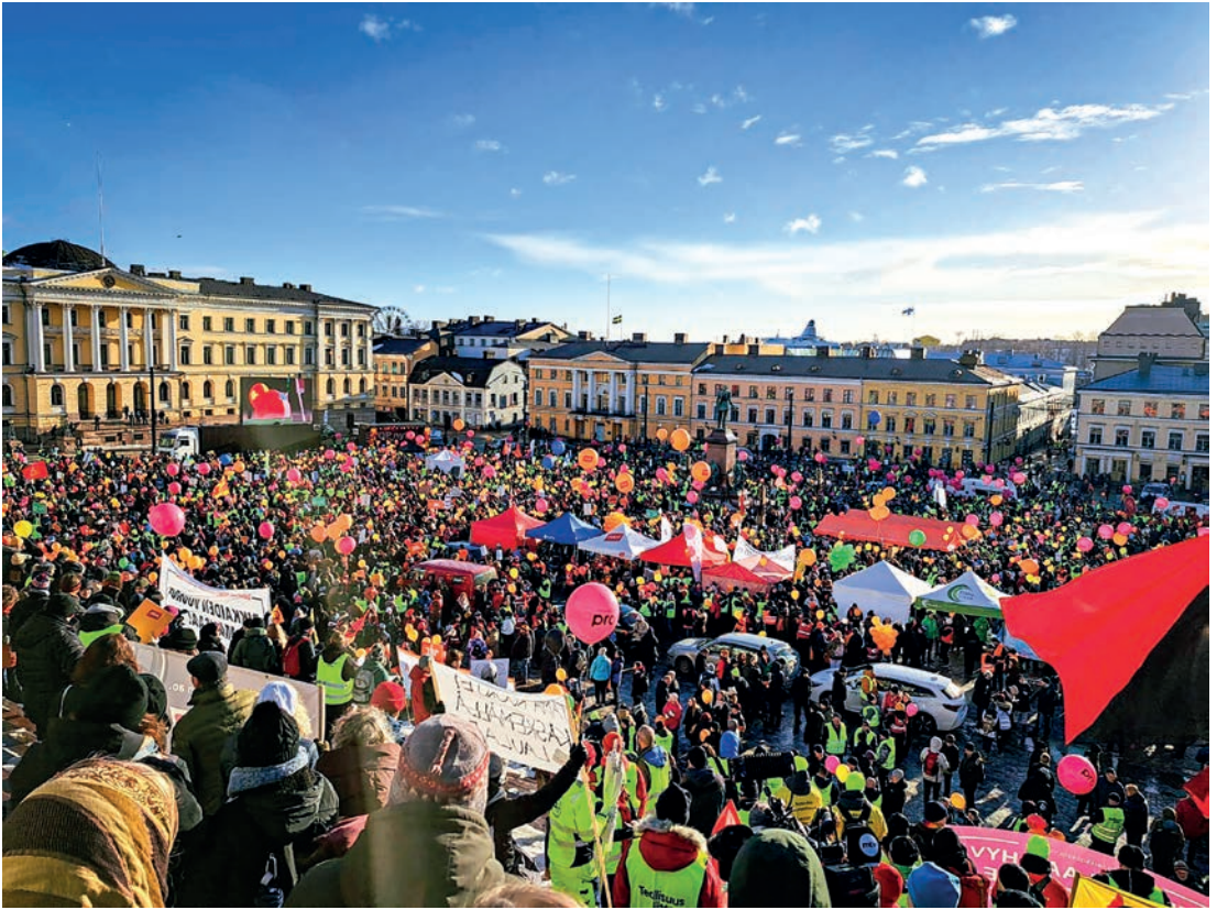
Ay-liikkeen mielenosoitus täytti Senaatintorin 1. helmikuuta.