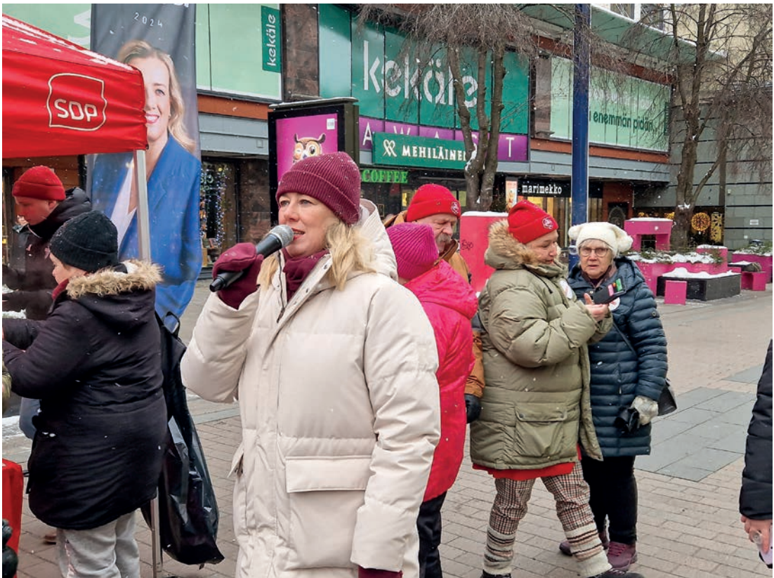
SDP:n ehdokas Jutta Urpilainen kävelykadulla joulukuun alussa.

SDP:n presidenttivaaliehdokas Jutta Urpilaisen tulos koko maassa ja Keski-Suomessa ensimmäisellä kierroksella oli iso pettymys. Ehdokas oli hyvä ja teki huikean kampanjan lyhyessä ajassa. Jutta toi omalla osaamisellaan ja arvopohjallaan vaalikeskusteluihin paljon toivoa paremmasta. Juttua keuhuttiin ja kannustettiin vaalitulaisuuksissa, mutta puheet eivät muuttuneet ääniksi. Äänestäjät eikä iso osa omasta puolueväestä ymmärtäneet, miksi Jutta asettui ehdolle myöhäisessä vaiheessa ja iso osa kannattajista oli jo siirtynyt Pekka Haaviston tukijoukkoihin jo ennen kuin Jutta virallisesti asettui ehdolle. Juttan kannatus Keski-Suomessa oli vain 5 prosenttia, mikä ei vastaa millään tavalla puolueen kannatusta Keski-Suomessa. Jutta Urpilainen keräsi Keski-Suomesta 8124 ääntä. Kevään 2023 eduskuntavaaleissa SDP sai 34956 ääntä, ollen maakunnan ykkönen. Tästä on suunta vain ylöspäin ja puolueessa on aloitettava tiekartan tekeminen kohti seuraavia vuonna 2030 pidettäviä presidentinvaaleja ja silloin sosiaalidemokraateilla on oltava vahva haastaja istuvalle presidentille.